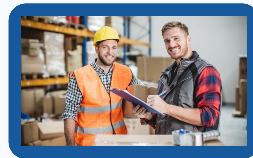
IL BADGE E LE TIMBRATURE