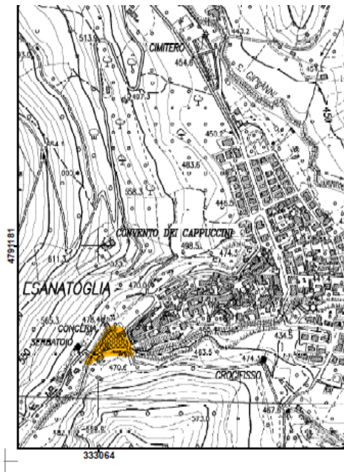
Fig.2 ubicazione area PAI id E-12-0031 (R3)

Servizio tecnico per gli interventi di ricostruzione