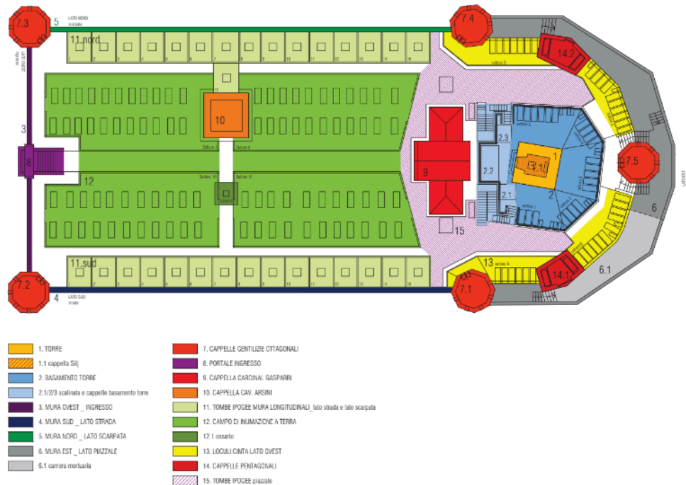
Fig. 3 - Illustrazione grafica in pianta delle opere componenti il cimitero monumentale (estratto dalla relazione generale del PFTE autorizzato in conferenza dei servizi speciale).

Il Commissario Straordinario del Governo per la riparazione, la ricostruzione, l'assistenza Alla popolazione e la ripresa economica dei territori delle regioni Abruzzo, Lazio, Marche e Umbria interessati dagli eventi sismici verificatisi a far data dal 24 Agosto 2016 Il Sub Commissario