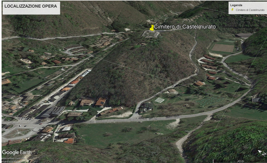
Fig. 1 - Localizzazione cimitero di Castelmurato nel comune di Ussita.

Il Commissario Straordinario del Governo per la riparazione, la ricostruzione, l'assistenza Alla popolazione e la ripresa economica dei territori delle regioni Abruzzo, Lazio, Marche e Umbria interessati dagli eventi sismici verificatisi a far data dal 24 Agosto 2016 Il Sub Commissario