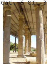
Area Archeologica "La Cuma"