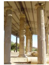
Area Archeologica "La Cuma"

e-mail: com.monterinaldo@provincia.fm.it pec: comune.monterinaldo@emarche.it