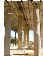
Area Archeologica "La Cuma"